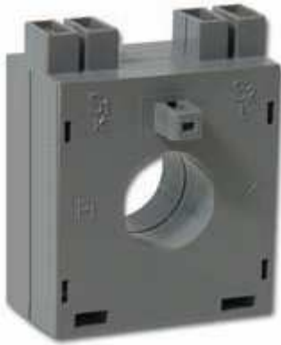
STROMWANDLER TM 1